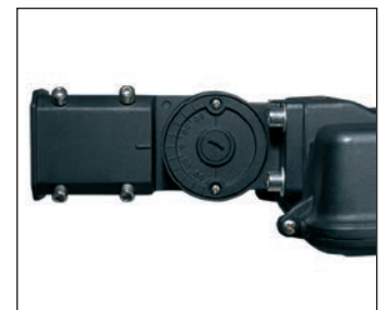
Grados de posición